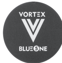
TAMPA DO MÓDULO MODULE COVER

Temperatura de desligar ajustável entre 35°C a 75°C Switch-off temperature adjustable between 35°C to 75°C Ponto de início 7 K (kelvin) abaixo da temperatura de desligar Start point 7 K (kelvin) below switch-off temperature Visor de operação Operation display Operação contínua e funções de desligar permanentemente Continuous operation and permanently shutdown functions