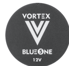
TAMPA DO MÓDULO 12V MODULE COVER 12V

Função de operação contínua Continuous operation function