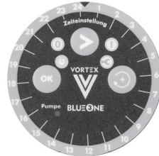
MÓDULO Z MODULE Z

Tecnologia AUTOlearn AUTOlearn technology Função de início automático Automatic start function Deteção de fim de semana/feriado Weekend / holiday detection 5 definições de conforto 5 comfort settings Visor de operação Operation display Operação contínua e funções de desligar permanentemente Continuous operation and permanently shutdown functions Função anti-legionella Anti-legionella function