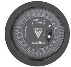
MÓDULO ZM/ ZM KT MODULE ZM/ ZM KT

Relógio de 24 horas 24 hour clock Incremento menor - 30 minutos Smallest increment - 30 minutes Ajustável através dos botões de pressão Adjustable through push buttons Visor de operação Operation display Operação contínua e funções de desligar permanentemente Continuous operation and permanently shutdown functions