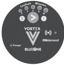
MÓDULO SL MODULE SL

Módulo de auto-aprendizagem com tecnologia AUTOlearn Self-learning module with AUTOlearn technology